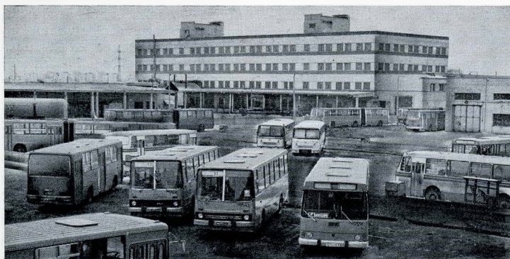
В седьмом автобусном парке, построенном в Московском районе, могут одновременно разместиться 500 многоместных автобусов.

На этих снимках запечатлены специально оборудованная площадка для отстоя машин и один из участков ремонтной зоны.