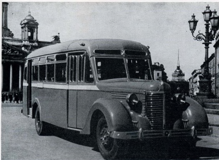
ЗИС-16, курсировавший на маршрутах с 1939 года. Ошибка! На фото послевоенная машина Л-4

Один из первых автобусов на улицах Петербурга. 1911 год.