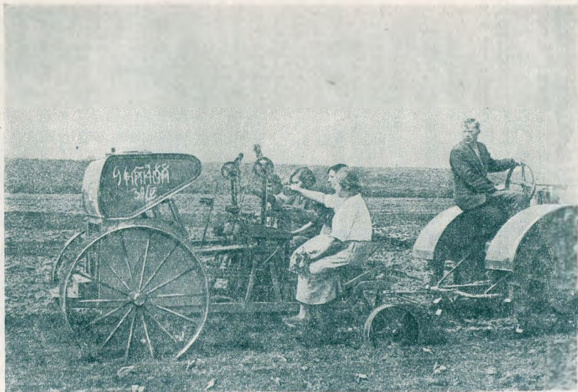
Посадка капусты рассадопосадочной машиной.