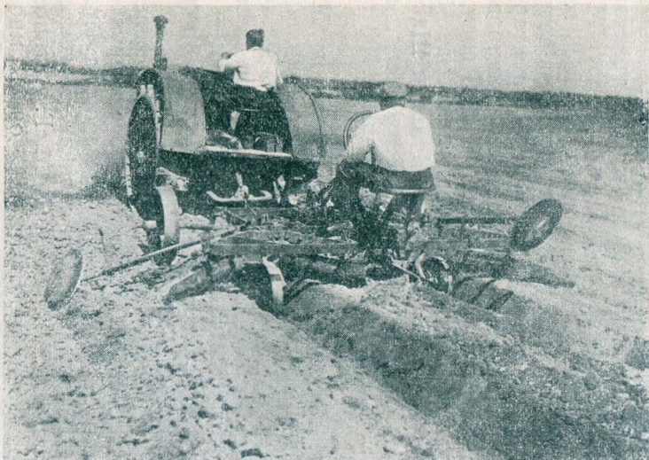
Поделка гряд тракторным грядоделателем